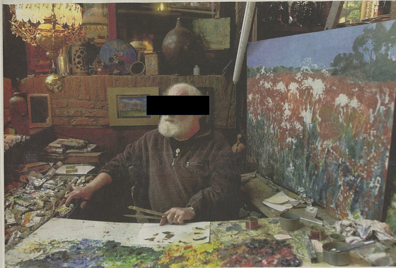
▲ Cor van L. in zijn atelier.

Van der Werff heeft ooit een gunstig 'voorlopig' taxatierapport opgesteld van twee omstreden doeken. "Maar het was voorlopig", stelt Van der Werff, die zegt ook toen al te hebben getwijfeld