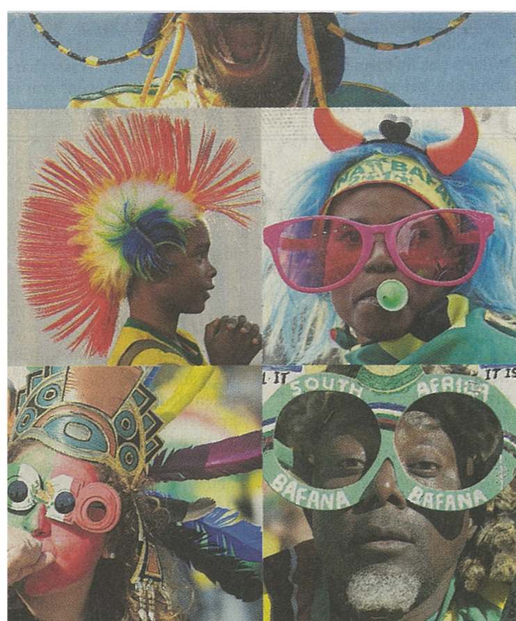
n Afrikaans feest. In het Soccer City Stadium kwamen onder ) ruim 1500 artiesten voorbij. De Amerikaan R. Kelly zong nd Tutu gaf een dansje ten beste op de eretribune. Daar ont- erstek liet gaan. >> 17