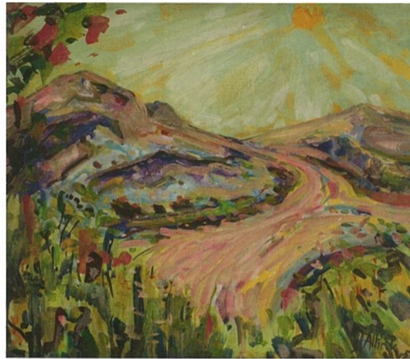
Het Reitdiep - Altink ▶▶